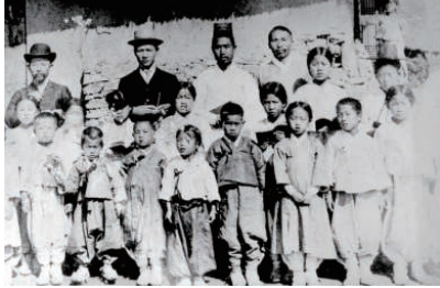
1906년 광진학교 교사와 학생들

오늘 우리가 함께했던 옛날의 사진이에요. 서양식 옷을 입은 어른도 있고, 한복을 입은 어린이도 있어요. 또, 옛날 서울의 모습도 있습니다.