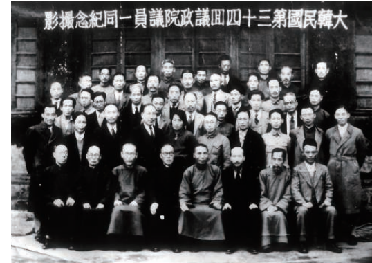
김구 선생님과 임시정부에 모인 독립운동가들

우리는 연극 속에서 김구 선생이 있는 상하이 임시정부에 갔었죠? 그곳에서 독립을 위해서 열심히 노력하는 김구 선생을 만났고, 우리도 우리나라의 독립을 위해서 노력하였습니다.